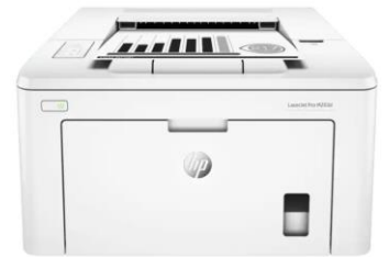
HP 레이저 젯 프로 M203DW